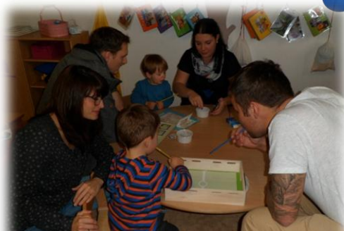
Pust- und Ansaugspiele