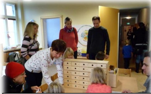
Anlaut- und Vorschulübungen